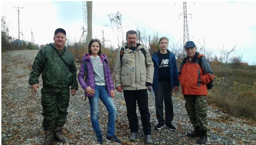
с. Федотовка. Начало похода

Всего с активными способами передвижения 11 км