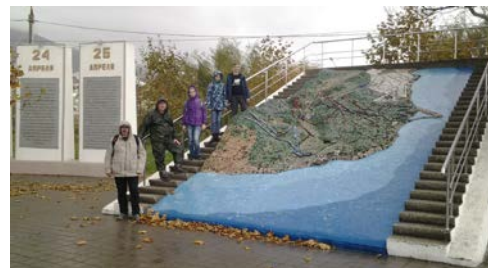
Мемориал Долина смерти