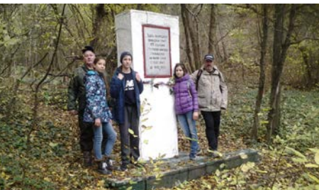
Памятник КП 107-й бригады