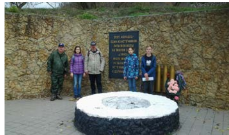
Памятник Колодец жизни