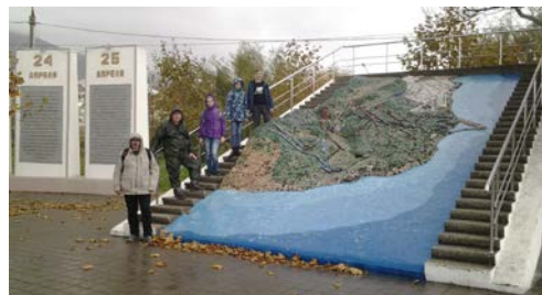
Мемориал Долина смерти