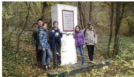
Памятник КП 107-й бригады